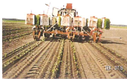
TEX - DT/6

The distance between rows can also be adjusted from a minimum of 50 cm. to a maximum of 90 cm. (over by request) in the Tex model, or from a minimum of 25 cm. to a maximum of 50 cm. in the Tex DT model (with double frame).