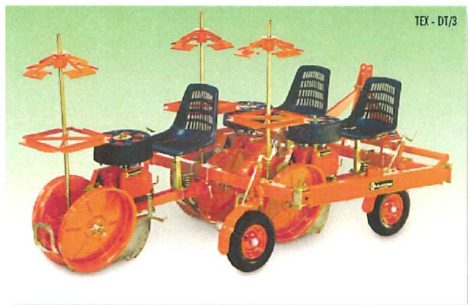
TEX - DT/3

La máquina, disponible en modelos de 1 a 7 hileras, tiene un distribuidor rodante de seis vasos que se abren por el fondo, con el cual se consiguen distancias en la hilera de 8 a 48 cm, más a petición. También la distancia entre hileras se puede regular de 50 cm minimum a 90 cm maximum (más a petición) en el modelo Tex, y de 25 cm minimum a 50 cm maximum en el modelo Tex DT (con doble bastidor).