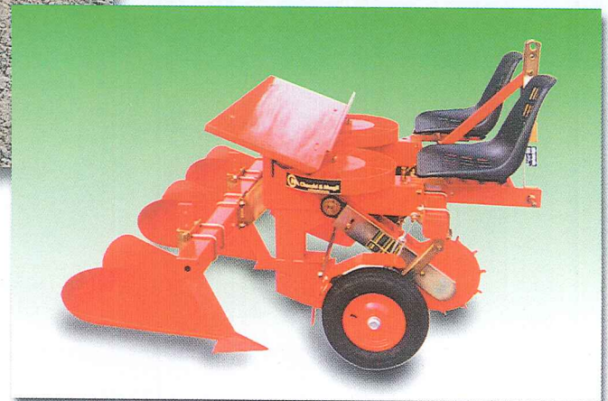
F300L/2 CON COPERTURA A VOMERI F300L/2 AVEC COUVERTURE PAR SOCS F300L/2 WITH PLOUGHSHARE EARTHING F300L/2 MIT PFLUGSCHARBEDECKUNG F300L/2 CON COBERTURA DE REJAS